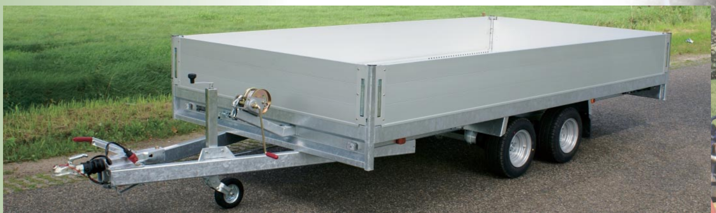
MSX 3000 met opzetborden <optie>