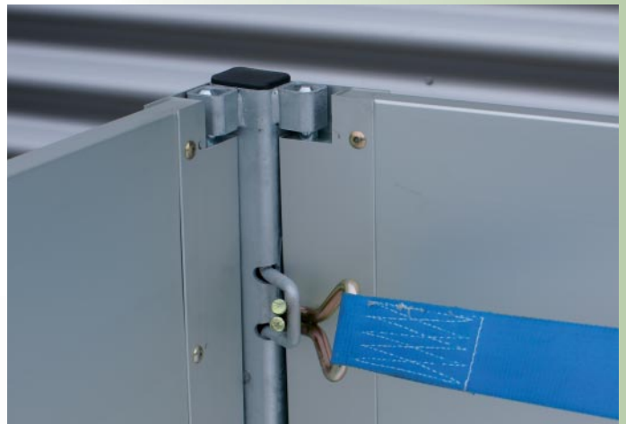
Bindhaak (bij opzetborden)