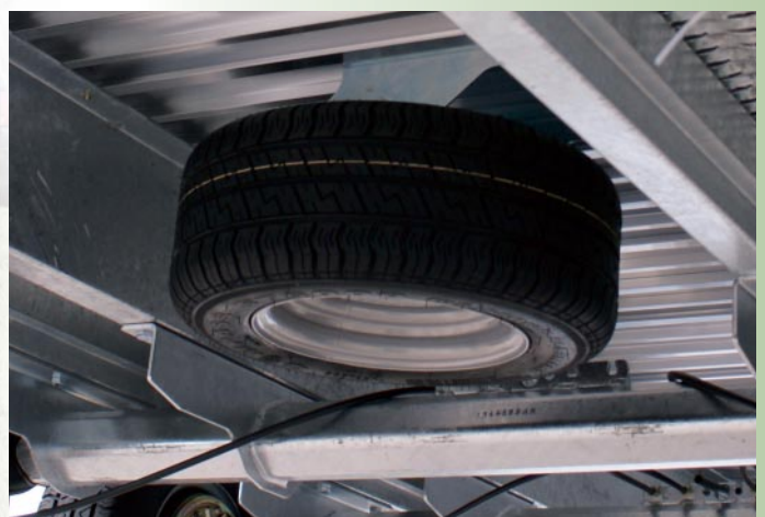
Reservewiel en houder (optie)